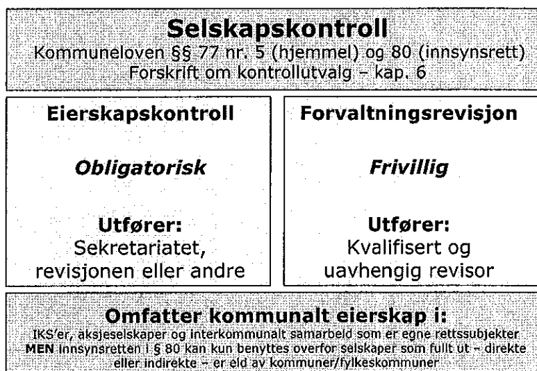
Figur: Selskapskontroll – overordnet skisse

Følgende figur viser selskapskontrollens omfang og innhold.